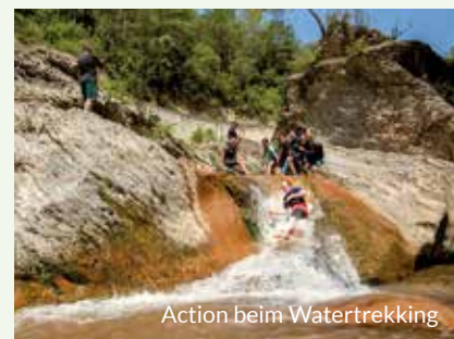
Action beim Watertrekking