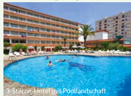
3-Sterne-Hotel mit Poollandschaft

geführter Halbtagesspaziergang durch Barcelona