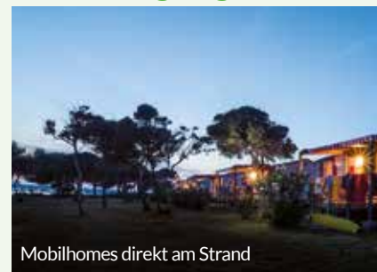
Mobilhomes direkt am Strand