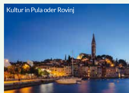
Kultur in Pula oder Rovinj