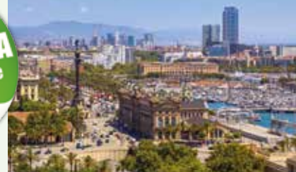
Tagesfahrt (z.B. Kloster Montserrat)

geführter Halbtagesspaziergang durch Barcelona