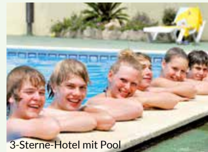
3-Sterne-Hotel mit Pool