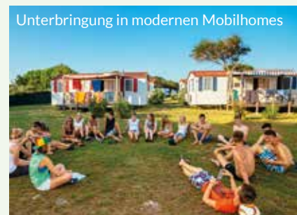
Unterbringung in modernen Mobilhomes