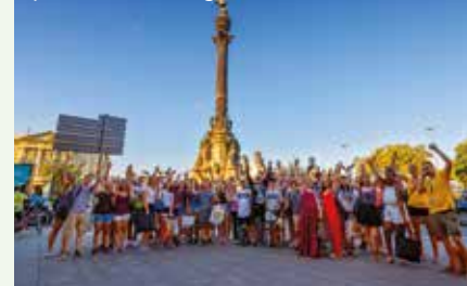
spannende Ausflugsziele wie Barcelona