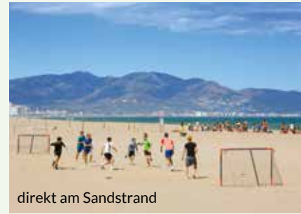
direkt am Sandstrand