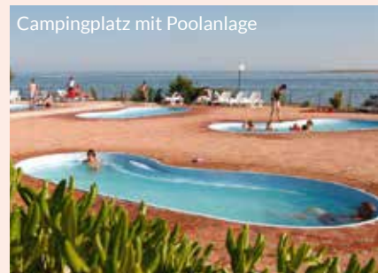
Campingplatz mit Poolanlage