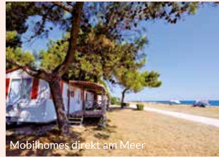
Mobilhomes direkt am Meer