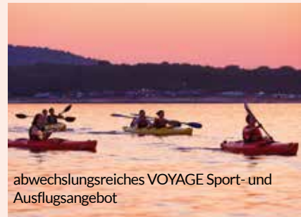
abwechslungsreiches VOYAGE Sport- und Ausflugsangebot