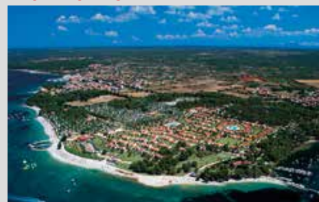
4-Sterne-Feriedorf gegenüber des Brijuni-Nationalparks