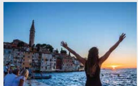
Ausflüge nach Rovinj

Mitzubringen sind: Schlafsack, Spannbettuch und Handtücher