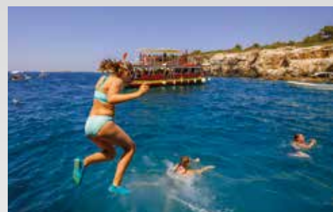
tolle Ausflüge buchbar