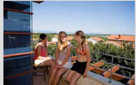
ein ganzes Haus nur für Ihre Gruppe