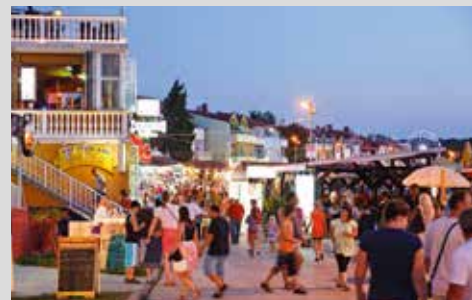
mitten im Badeort Medulin gelegen