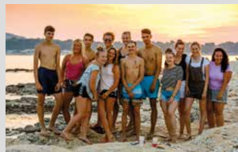
ca. 100 m zum Strand