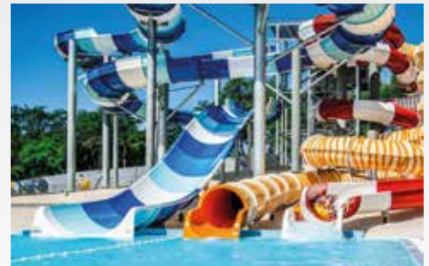
Ausflug in den Wasserpark Istralandia