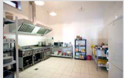
gut ausgestattete Selbstversorgerküche