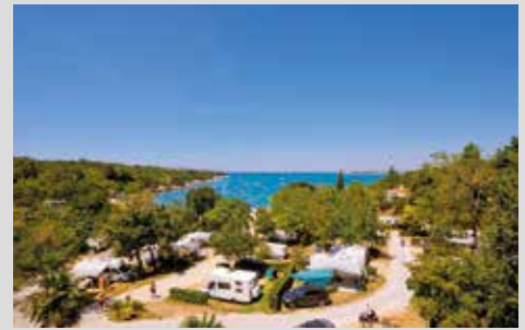
einer der besten Campingplätze Europas