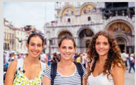
Ausflüge nach Venedig