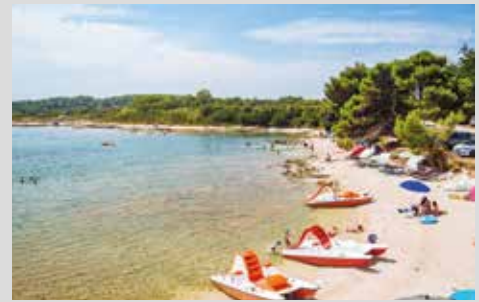
abseits der Touristenströme, nah am Meer gelegen