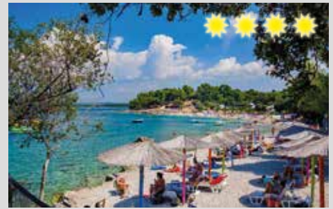
direkt am 1500 m langen Kiesstrand