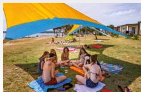
viel Platz für Gruppenaktionen