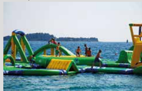
Lage direkt am Meer mit Wasserpark