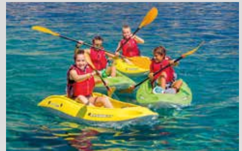
kostenfreier Verleih von Sit-on-top-Kajaks