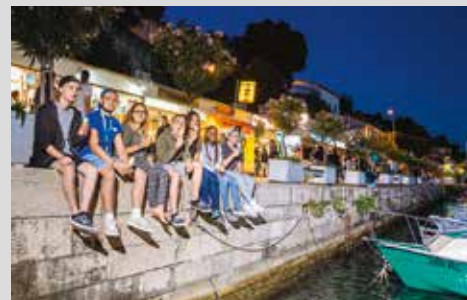
lebendiger Ort in Fußnähe