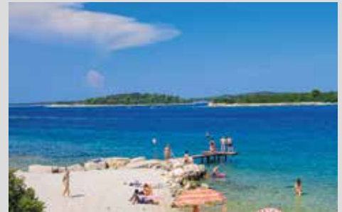
Blick auf die Brijuni Inseln