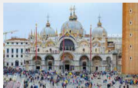
Ausflug nach Venedig