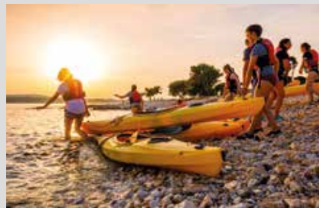
eigene Kajak- und Mountainbike-Station