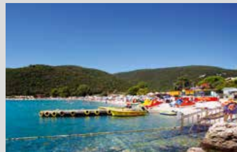
Urlaub an einer traumhaften Badebucht