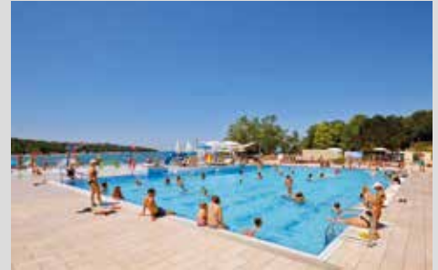
tolle Poollandschaft mit Meerblick