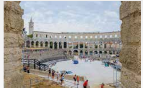
Ausflug nach Pula