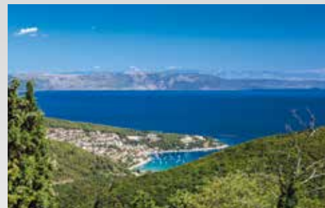
Wanderung nach Labin