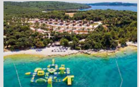
Wasserpark im Meer