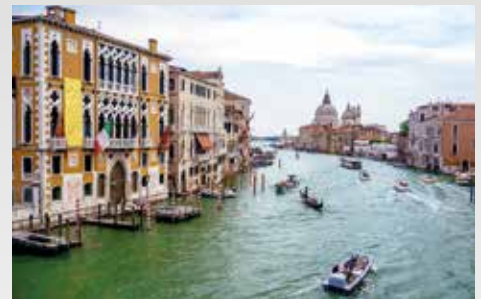
Ausflug nach Venedig