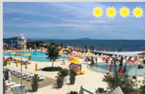
4-Sterne-Campingplatz mit neuer Poolanlage