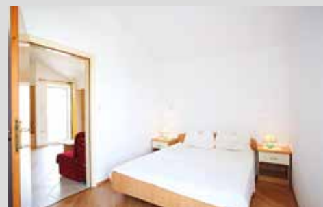
helle und großzügige Appartements