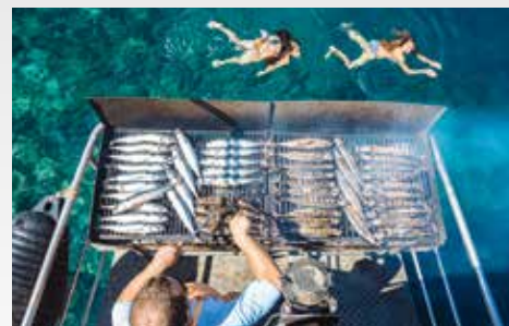
Bootsausflug zur Insel Cres mit Fischpicknick